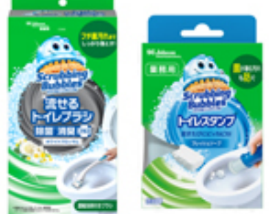
スクラビングバブル 業務用 左: 流せるトイレブラシ、右: トイレスタンプ

除菌・消臭ができる「洗たく槽カビキラー業務用」、除菌・手指消毒剤の「ファミリーガードシリーズ業務用」などです。