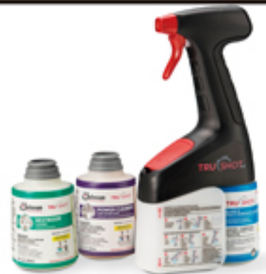
TruShot (トゥルーショット) 本体タンクに水を入れてトリガーを引くと、自動的に希釈された洗剤が噴霧される 左: トイレ水回り用(緑)、中: 油污れ用(紫)、右: スプレー本体+ガラス多目的用(青)

希釈の作業時間・負担・リスクを減らし、希釈に関する教育やマニュアルも不要となります。TruShot では 296 ml の濃縮洗剤カートリッジから約 40 L (ガラス多目的用)、TruFill は 2 L の濃縮洗剤カートリッジから 1025 L の希釈洗剤を作ることができます。いずれも ECOLOGO 認証 UL2759 取得済み、LEED 認証取得にも貢献します。