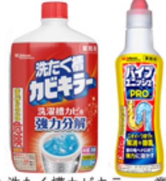
洗たく槽カビキラー 業務用、パイプユニッシュ PRO 業務用

是非一度製品をお試し頂き、実感していただければ幸いです。今後とも何卒よろしくお願い申し上げます。