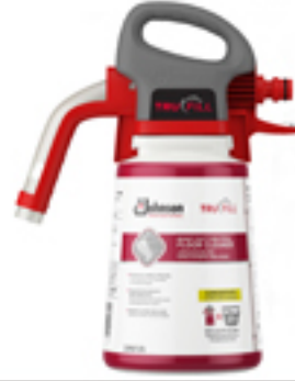
TruFill (トゥルーフィル) ホースで本体と蛇口をつなぎ、水を流すと、自動的に希釈された洗剤が出てきます。そのまま洗浄機のタンクに入れて使用可能です。

その他の製品 既存のジョーンソン家庭用製品にも「業務用用途で使用したい」との声をいただいております。それにこたえる形で製品ラインナップを展開しております。