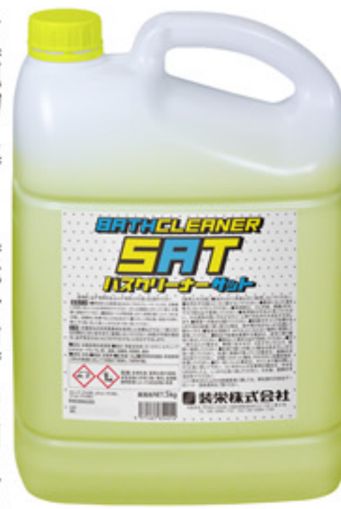
バスクリナーサット

「ほのかに香るレモン」 新商品の「バスクリナーサット」を発売開始致します。 忙しいエッセンシャルワーカーの皆さんにお勧めしたい！