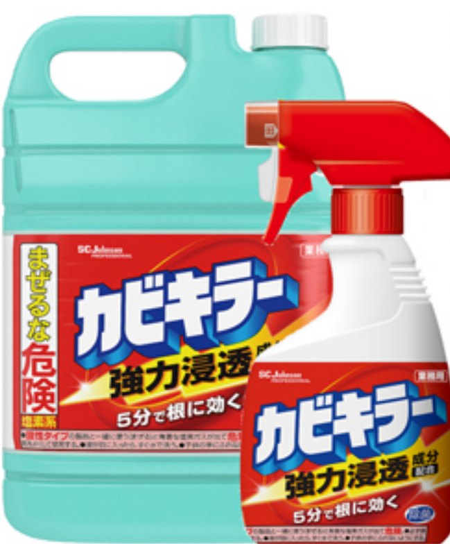
カビキラー 業務用 左：つめかえ5kg 右：本体520g

つめかえ5kgはつめかえ時に発生する脈動を防止するノズルが付属し、つめかえ中にこぼしてしまうリスクを低減します。