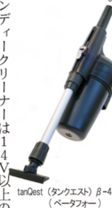
tanQuest (タンクエスト) β-4 (ベータフォー)

マーパックに吸い込み、嘔吐物に手を触れずに処理が数秒で可能となる画期的なアイテムです。現在お使いの各社業務用充電式ハンディクリーナーまたは背負式クリーナーに装着が可能(口径32.5×35.2mm)で簡単便利にご利用いただけます。