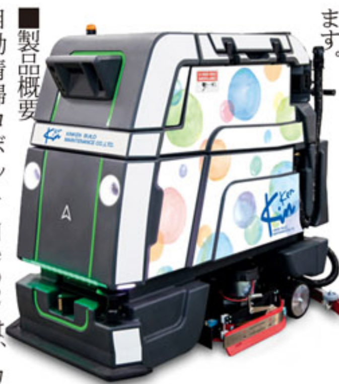
自動清掃ロボット Neo2

今回は、弊社で取り扱う自動清掃ロボット Neo2 (カナダ Avidbots 社製) と京都駅前地下街ポルタでの導入事例をご紹介します。