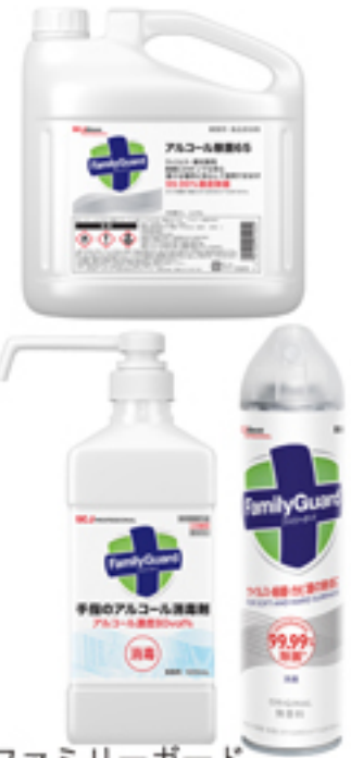
ファミリーガード 左: 手指のアルコール消毒剤、中: アルコール除菌 65、右: 除菌スプレー