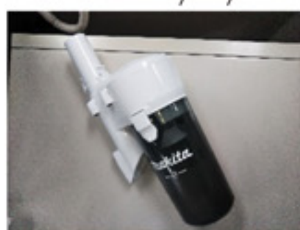
②ショートサイクロンアタッチメント

最後にご紹介するのはカプセル式掃除機用の③『HEPAフィルタ』です。まずHEPAフィルタというのは空気清浄機にも使用されている捕集性能が非常に高いフィルタの事です。例えばダニの糞やカビの胞子などをほとんどシャットアウト出